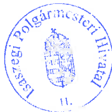
Hatvani Miklós polgármester