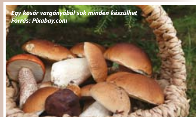
Egy kosár vargányából sok minden készülhet