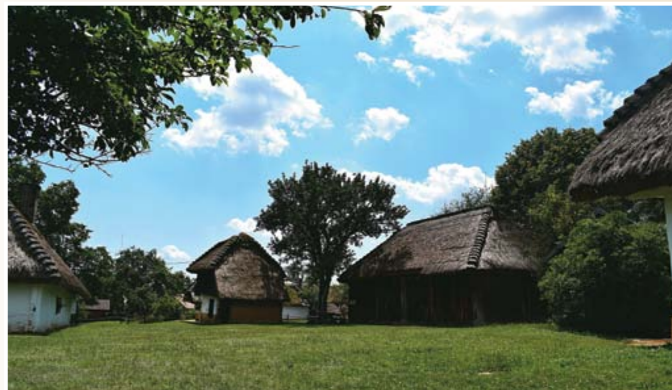
Az Őrségi Nemzeti Park védelme alatt álló terület pártját ritkítja

lyünkön lesz lehetőség az ebéd elfogyasztására. Tekintettel az utazás fáradalmaira, érdemes inkább közeli turisztikai célpontot keresnünk. A 2005-ben városi rangra emelt kistelepülés sok látnivalót tartogat. A város nevét az 1200-as években épült, román stílusjegyeket viselő Szent Péter-templomáról kapta. Semmiképp se mulasszuk el Nyugat-Dunántúl talán legszebb középkori templomának a megtekintését. Érdekes programmal kecsegtet az Őriszentpéteri művelődési házban kialakított helytörténeti múzeum. A kiállítás az Őrség történetét és az itt élő emberek mindennapjait tárja a látogatók elé. Nagy látványosság a nyolcvanas években restaurált téglaegeető. Itt készültek azok a téglák, amelyeknek a segítségével a törökök elleni harcok alatt erődde alakították a helyi katolikus templomot. A Csörgőalma gyümölcsöskertben a helyi gyümölcsfajtákat mutatják be, amelyek jól bírják a magyar átlagnál hűvösebb klímát és az agyagos, savanyú talajt. A kert legmeghatározóbb gyümölcsje az alma, amelynek közel ötven fajtája honos a vidéken.