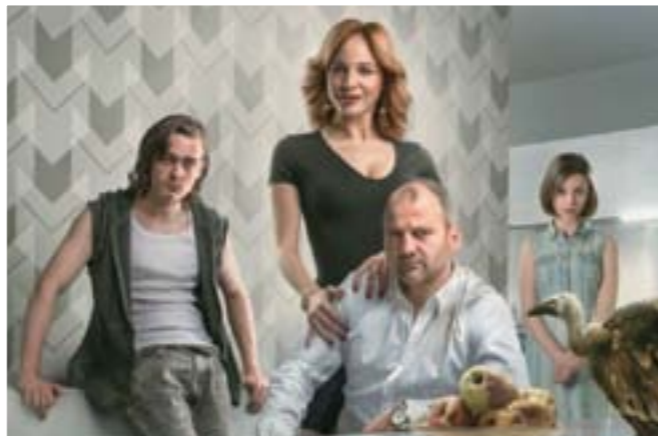
Látszólag minden rendben, azonban a rohadás jelei itt-ott már felfedezhetők