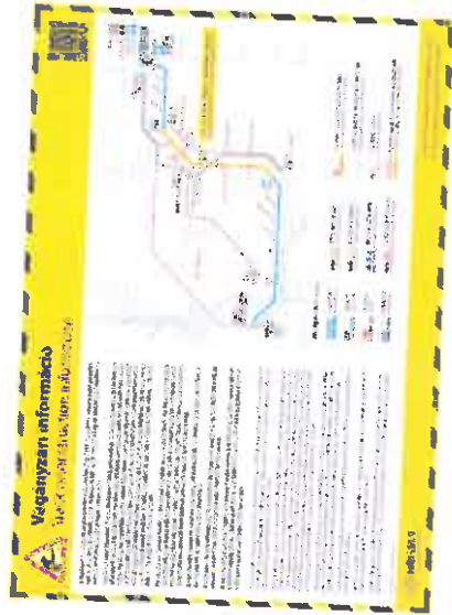
Térképes vágányzári hirdetőmény a 80a vonalon érvényes közlekedési rendről