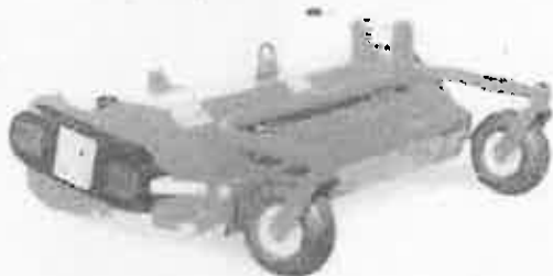
„Y” késes szárúzó adapter