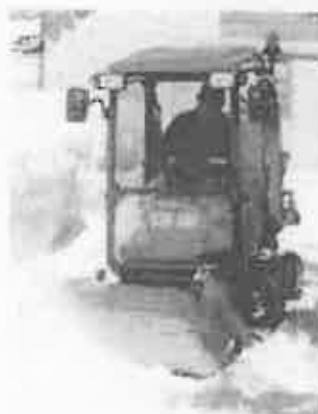
hóseprő - hengerseprű