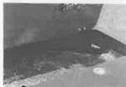
műfü karbantartó eszköz