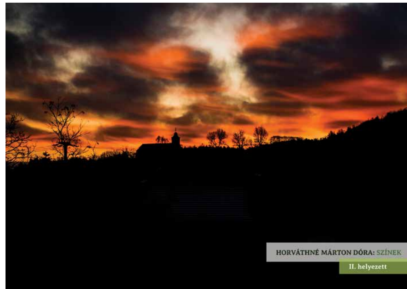
HORVÁTHNÉ MÁRTON DÓRA: SZÍNEK