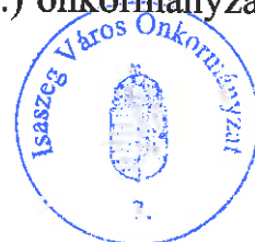
Hatvani Miklós polgármester