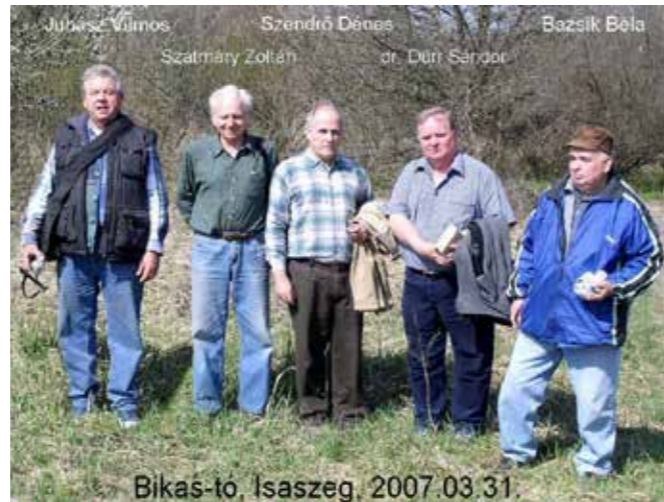
A fotó 2007-ben az isaszegi Bikas-tónál lévő őstelepülés leletkutatásánál készült

Kezdetben saját pénzen fejlesztett, majd drága áron vásárolt profi fémkeresőket használt az Isaszegen és környékén előforduló mágnesezhető anyagok – így a fémből készült