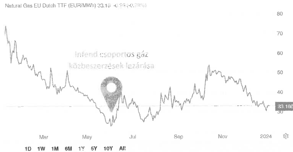
1. ábra: Földgáz piaci ár 2024. január

indukálja a fűtés iránti keresletet. Párizstól Berlinig fagyponthoz alatti hőmérséklet várható, mely január közepéig tart. Emellett a gáztüzelésű erőművek kihasználtsága valószínűleg növekedni fog, mivel a megújuló energia termelése az előrejelzések szerint csökkenni fog. A gázmérlegre gyakorolt hatás azonban korlátozott lesz, mivel a tárolók továbbra is telítettek maradnak a szokásosnál, és elegendő mennyiséget szállítanak csővezetéseken és tartályhajókon keresztül. Az Európai Unióban, így Németországban, Franciaországban és Olaszországban a gáztárolási szint 2024 januárjában 81% és 91% között mozog.