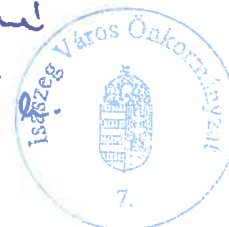
Hatvani Miklós polgármester