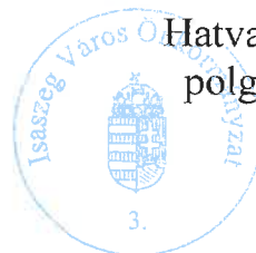
Hatvani Miklós polgármester