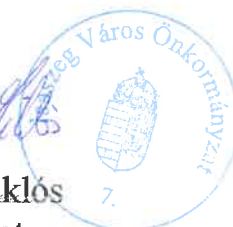
Hatvani Miklós polgármester

Handwritten signature of Miklós Hatvani in blue ink.