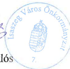
Hatvani Miklós polgármester

Handwritten signature of Miklós Hatvani in blue ink.