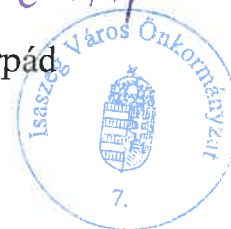
Dr. Budaházi Árpád polgármester