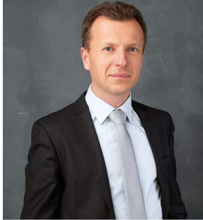
Dr. Budaházi Árpád polgármester

Ezúton is köszönöm mindenkinek a munkáját, segítségfelajánlását, ötletét, észrevételét, tanácsát. Az isaszegiekben lévő tenniakarás és kreativitás mind-mind meg fogja hozni a gyümölcsét. Az újság tartalma is mutatja, hogy élettel teli város vagyunk, egy olyan közösséget alkotunk, amely képes arra, hogy összefogjon. A közös munka segíthet abban, hogy élhető városban lakjunk, amely tiszta, rendezett, esztétikus és biztonságos.