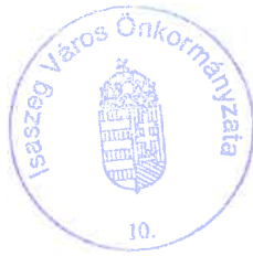
Dr. Budaházi Árpád polgármester