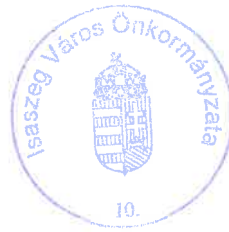
Dr. Budaházi Árpád polgármester