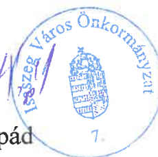
Dr. Budaházi Árpád polgármester